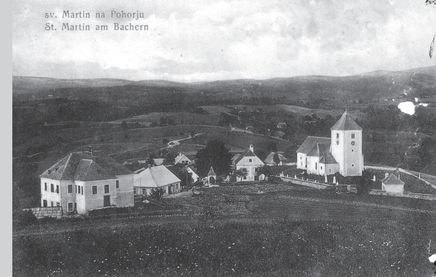
sv. Martin na Pohorju St. Martin am Bachern