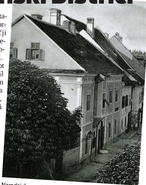
Narodni dom - stavba hotela pred prezidavo, 1902

Kmalu je postala znana slovenjebistriška hotelirka in go-