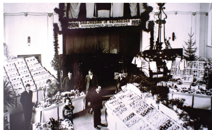
Sadjarska in vrtnarska razstava v hotelski dvorani