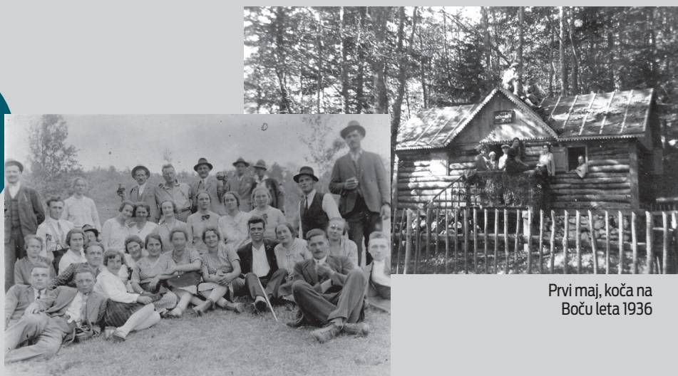
Prvi maj, kočna na Boču leta 1936