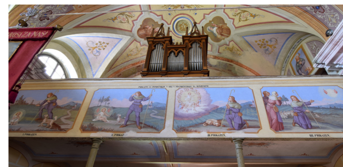
Štiri videnja na ograji pevskega kora