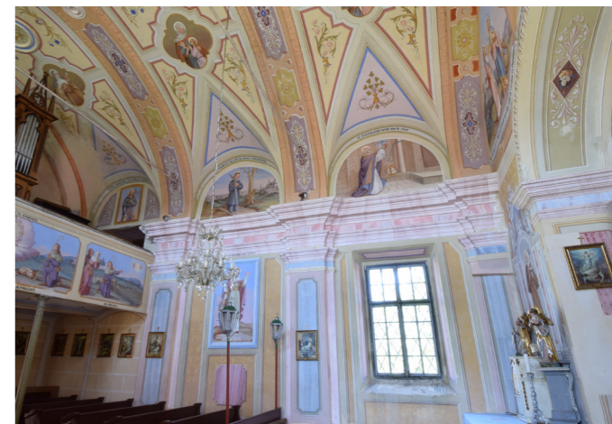
Poslikava oboka in severne ladijske stene

Vsebine slik je zelo zanimiva, nekateri prizori in upodobljeni svetniki so precej redki. Nedvomno je ravno poslikava sv. Egidija tako posebna med cerkvami na Slovenjebistriškem in v okolici.