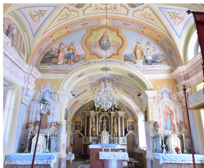
Poslikava slavoloka in naslikana stranska oltarja

Edini od štirinajsterice, ki ni umrl mučeniške smrti, je cerkveni zavetnik sveti Egidij. Bil je puščavnik, ki je živel v Franciji, v votlini, h kateri ga je hodila obiskovat in s svojim