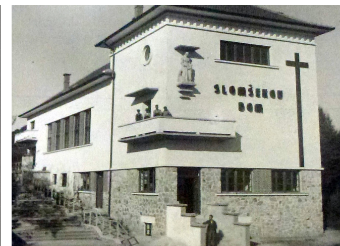
Slomškov dom leta 1938, foto - Župnijska kronika

Kiparska skupina je bila nameščena na pročelju leta