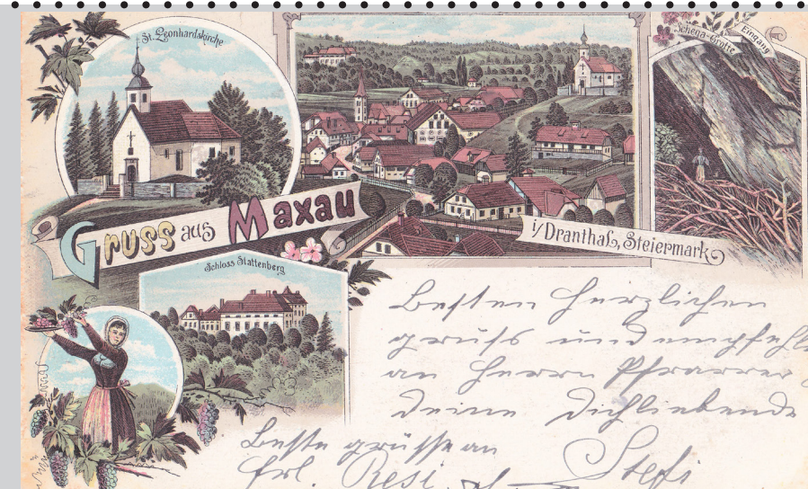
Makole, risana razglednica, okrog leta 1900