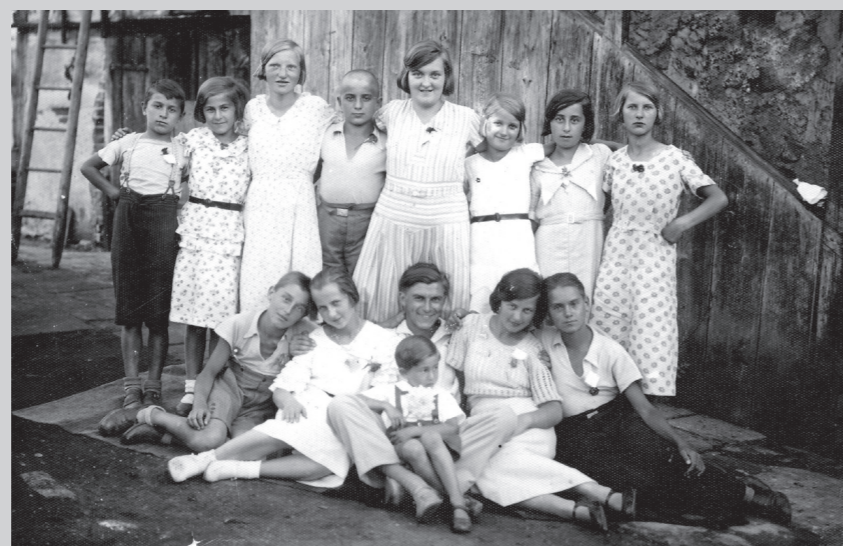
Otroško kulturno društvo v Makolah okrog leta 1930