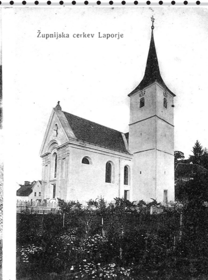
Razglednica Laporja leta 1912