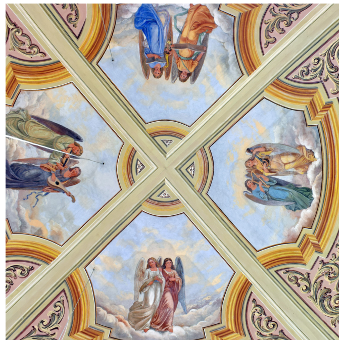
Cirkovce, obok prezbiterija župnijske cerkve

Ačko je imel obrtni obrat v lastni hiši na Partizanski ulici 3 (takrat Šolski ulici) v Slovenski Bistrici. V pritličnem prostoru, ki je gledal na dvorišče, je imel, kot pravi gospa, ki se tega še spominja, atelje, v katerem je slikal. Nekateri se spominjajo tudi še njegovih stenskih slik v nekdanji gostilni Kos na isti ulici. Slike, ki so danes pod beležem, bi naj prikazovale vedute Slovenske Bistrice, in sicer bi naj Ačko na steno prenesel motive iz bakrorezov G. M. Vischerja s konca 17. stoletja.