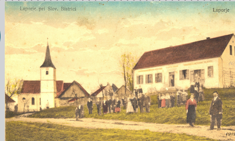
Razglednica iz Laporja leta 1912