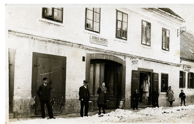
Slovenska Bistrica, Partizanska ulica 3, 1932, foto: Zavod za kulturo Slovenska Bistrica

Leta 1933 je v Makolah v celoti prenovil pokopališko kapelo sv. Jožefa , in sicer je poslikal celotno kapelo, restavriral oljne slike ter posrebril železna vrata