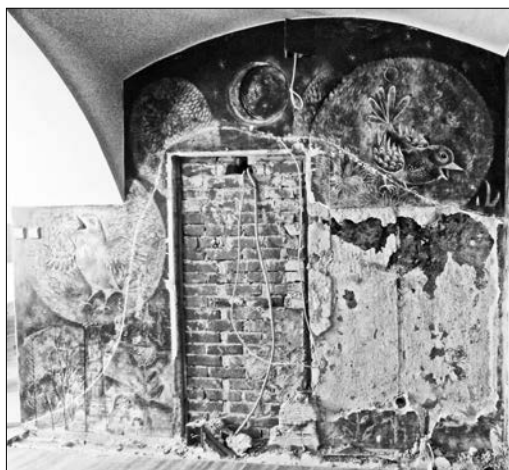
Ostanki stenske slike Janeza Vidica na krajši steni, Gosposka ulica 23, Maribor