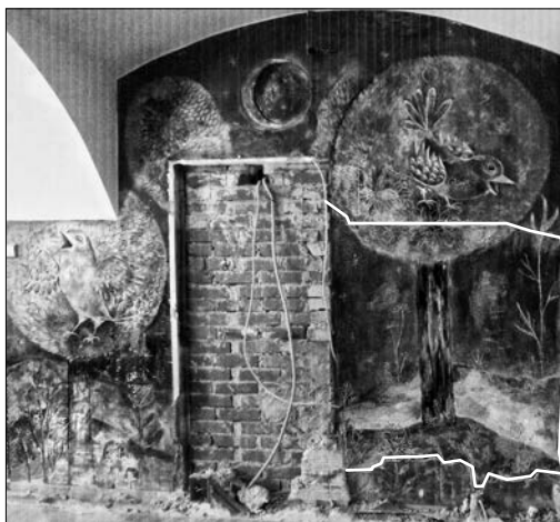
Poskus rekonstrukcije na osnovi ohranjenih fragmentov, sočasnih in motivno sorodnih del (Simona Kostanjšek Brglez, 2019)

V zadnjih tednih, ko je bil »primer Vidic« tudi medijsko izpostavljen, 17 je bilo z različnih koncev večkrat slišati vprašanje »kdo je kriv?«, med glavnimi »krivci« za uničenje umetniškega dela pa sta bila navedena Umetnostna galerija Maribor (UGM) in ZVKDS. Prva inštitucija vodi evidenco oziroma fototeko likovnih del umetnikov tega prostora, druga je pristojna za spomenike nepremične kulturne dediščine; tega statusa pa objekt z Vidičevo sliko nima. Dejstvo je, da to delo do leta 2015 ni bilo evidentirano, torej nista bili ne prva ne druga inštitucija seznanjeni z njegovim obstojem. In če bi bili? Če bi bilo delo v UGM evidentirano, in če bi bil (zaradi njega) objekt s strani ZVKDS z odlokom ustrezno zaščiten – bi bilo v tem primeru drugače? Bi lahko katera od omenjenih inštitucij dejansko preprečila njegovo uničenje? In naprej. Ali ima katera od inštitucij zaposlenega »inšpektorja«, nekoga z »velepooblastilom«, neomejenim nalogom za pregled in nadzor – tudi zasebnih objektov, ki lahko leto za letom, dan za dnem in uro za uro spremlja aktualna dogajanja v objektih? 18 Nima. Nobena od inštitucij, na katere se kaže s prstom,